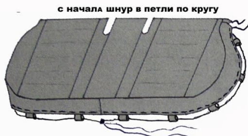
чехол заднего сидения